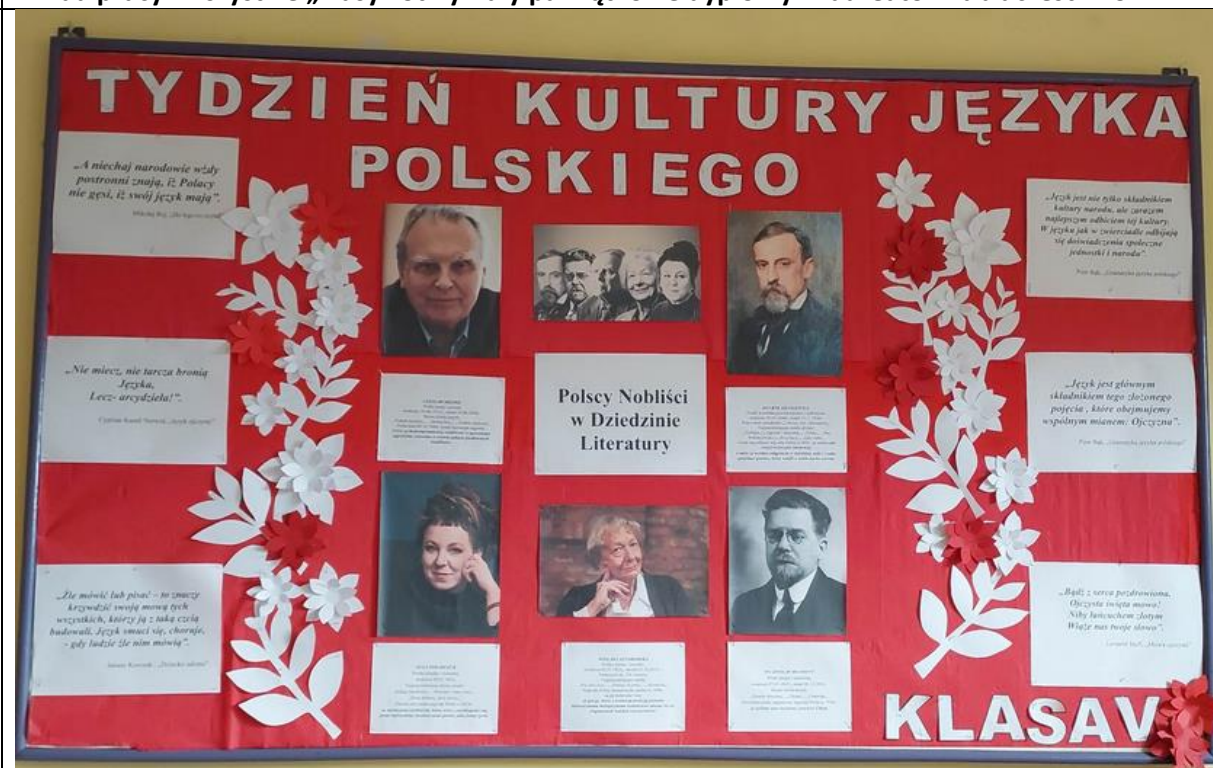
zdj. 1- I miejsce – gazetka wykonana przez uczniów kl. V

Uwaga! Nie więcej niż 4 zdjęcia, które powinny być podpisane i umieszczone w relacji.