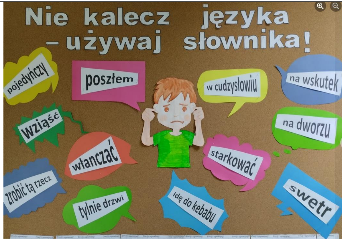
zdj. 2 – II miejsce – gazetka wykonana przez uczniów kl. II