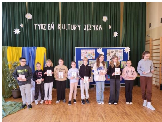
MIĘDZYSZKOLNY KONKURS LITERACKO-PLASTYCZNY -na komiks w oparciu o „Legendę o powstaniu Buska” F. Rusaka