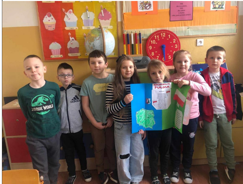
Uczniowie klas I oraz III z plakatami historycznymi oraz lapbookami