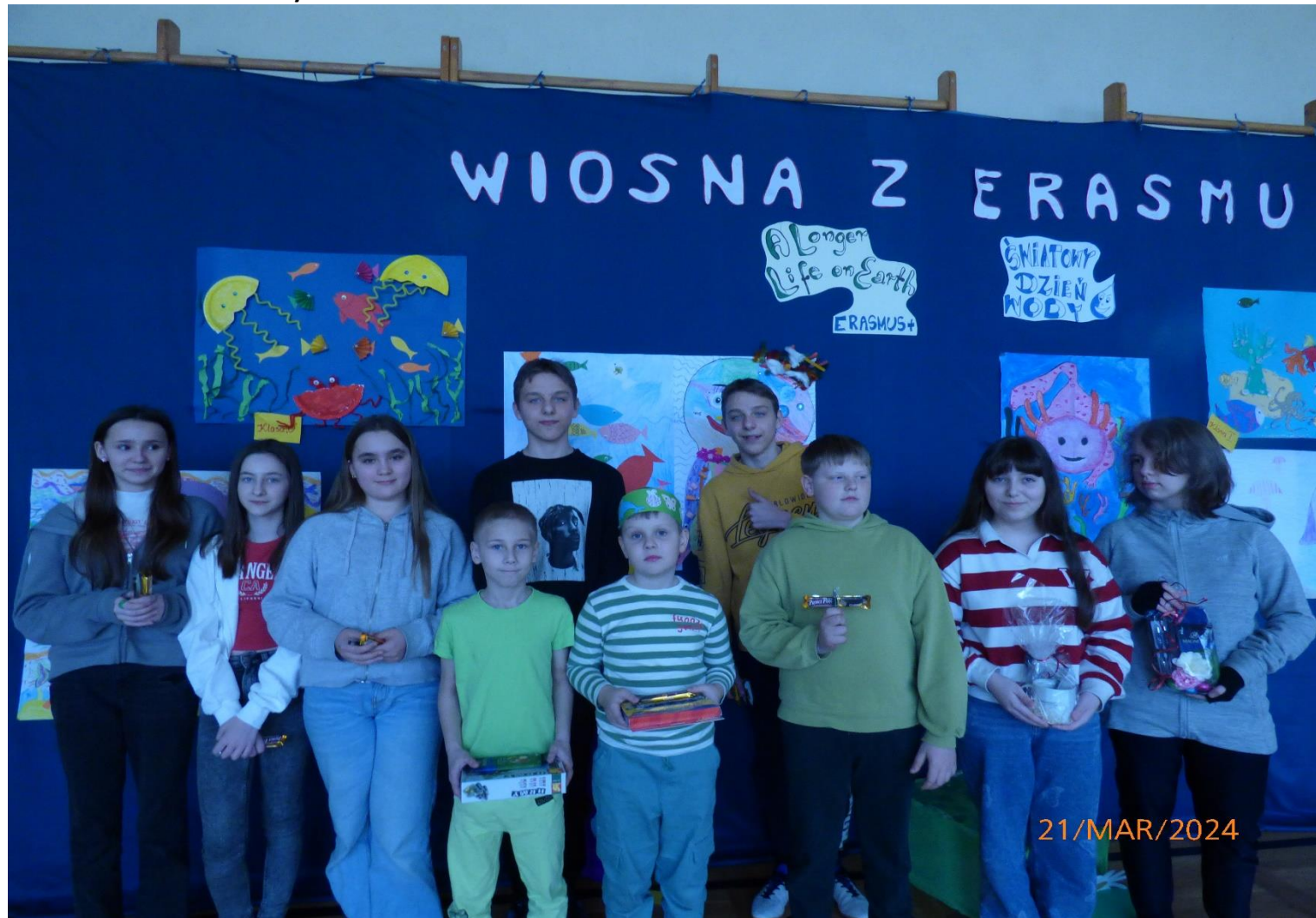
Laureaci konkursów szkolnych w ramach XXXII TKJ