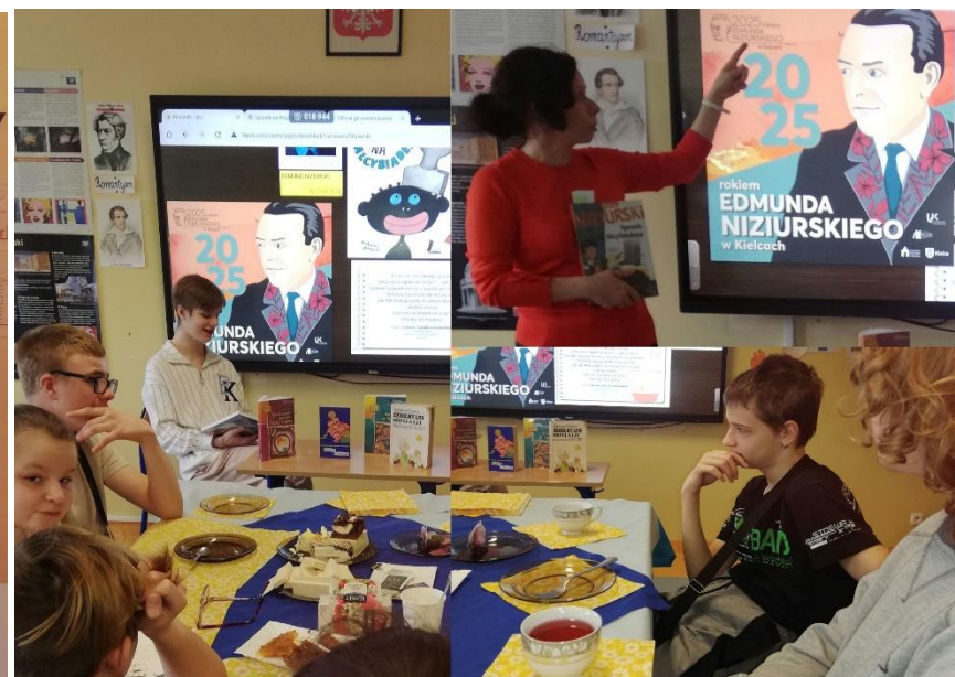
Głośne czytanie powieści „Sposób na Alcybiadesa” E. N.