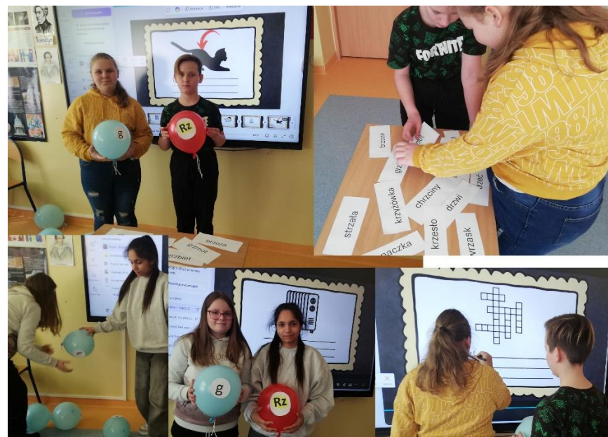
„Ortografia na wesolo” – warsztaty edukacyjne